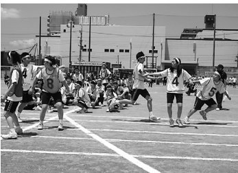
色別対抗リレー 必死にバトンをつないでいます