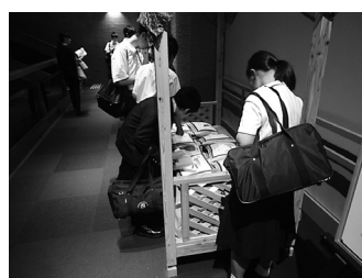
古代の占いは人気がありました

今回の見学では、国の重要文化財でもある「風雷神神図」などの貴重な文化財などを見たり、古代の占いを実際に体験したりして、日本の文化を学ぶことができました。また、体験するだけではなく、博物館の職員の方から、博物館の仕事についてや仏像の文化の変遷についてなどパワーポイントを使って説明していただきました。生徒たちにとっても今回の社会科見学は、普段の学習だけでは学ぶことのできない、日本や東洋諸地域の歴史について学ぶ良い機会となりました。