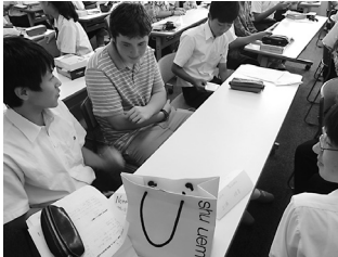
日本の文化について説明しています

またこのような交流がある場合には、自分から積極的に話しかけて交流していきたいと思いました。