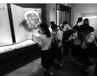
風雷神神図と共に

今年度は、東京国立博物館に行ってきました。東京国立博物館は、日本の総合的な博物館として、日本を中心に広く東洋諸地域にわたる文化財を収集・保管して公衆の観覧に供するとともに、これに関連する調査研究および教育普及事業等を行うことにより、貴重な国民的財産である文化財の保存および活用を図ることを目的としています。