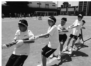
力一杯綱を引いています

てくる競技です。走ることにあまり得意ではない僕にとって、運が関係してくるこの競技はとても楽しみでした。実際にスタートをすると、僕が走り出した方が当たりで、そのままゴールすることができました。結果は三位でした。とてもうれしかったです。