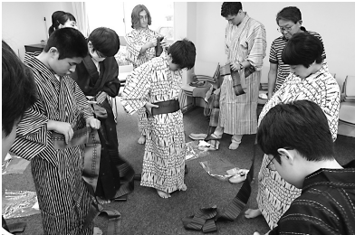
上手に着られるかな?

浴衣着付け体験は、日本の衣服文化の一つである浴衣の着付け方法を学び、実際に着る体験を通して、日本の文化を大切にすることを養う目的として行われています。これからの時期は、夏季特活も始まり、花火大会や夏祭りといった浴衣を着る機会が増えてきます。今回学習したことを生かして、浴衣を着こなし、楽しい休暇を過ごしてほしいと思います。