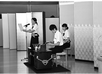
お点前を披露しています