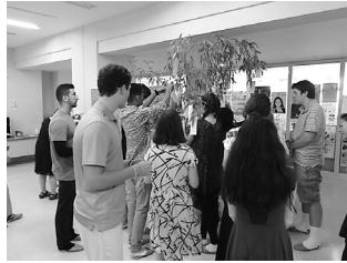
七夕のお願い事を書いてから授業が始まりました