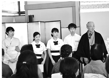
本番が近づき緊張しています

今回の体験を通して、どんなことでもしっかりと準備をして取り組むことが大切だと感じました。