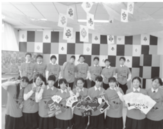
2-2 シークレットカジノ

私たちはシークレットなカジノを行いました。カジノらしさを出すために扉、壁など、教室中を赤と黒で埋めつくしました。二五〇名以上の多くの方が足を運んで下さり、盛り上がりました。