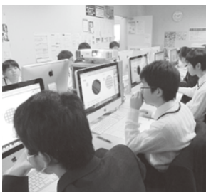
キーホルダー作り

新しくパソコンの知識が増えて良かったです。最後の芸術体験を終え少し寂しい気持ちですが、これからも芸術に興味を持ち続けたいです。