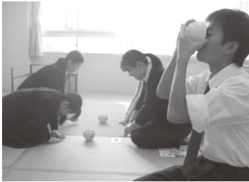
1-1 お茶のおもてなし

私たちは茶道の陰立てをしました。一五〇人以上のお客様が来て下さいました。小学生の時は客として参加した雄飛祭に、今年もてなす側で参加し、相手の気持ちを考えることを学びました。