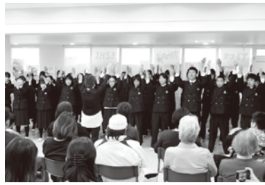
中3 ゴスペルを披露

各クラスとも、時間をかけて準備した出し物を、多くの来校者に見てもらおうとで得た喜びがあったのではないのでしょうか。