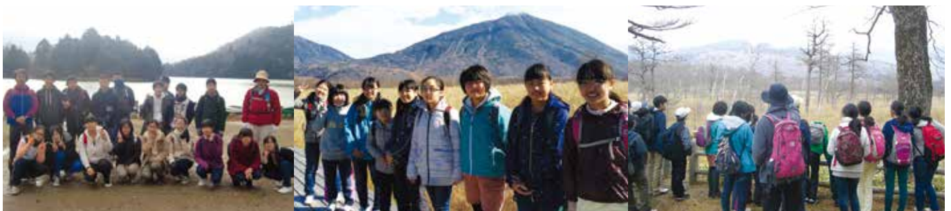
中学校/ハイキング