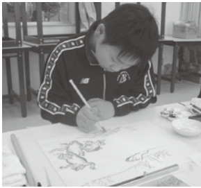
鳥獣人物戯画の模写

私は文星芸術大学での芸術体験で鳥獣戯画の模写をやりました。初めに和紙や絵の具の話をお聞きしました。絵の具が全て自然のものでできていると聞いてとても驚きました。今回は鳥獣戯画に想像で色をつけました。色を濃くしたり薄くしたりするのが難しかったです。なかなかできない体験ができたので、とてもうれしかったです。