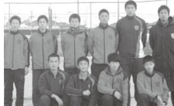
初戦の相手は浦和学院(埼玉)です。