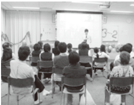
3-2 オリジナル映画上映

私たちは、短編映画の製作・上映を行いました。なかなか完成しないまま当日の朝を迎え、一般入場の時間になってやっと仕上がりました。かなり焦りましたが、無事完成し、たくさんのお客様に見ていただけるとても楽しかったです。