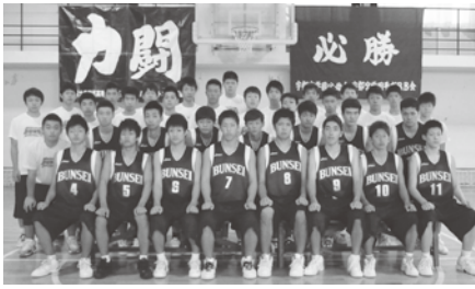
初戦の相手は対聖和学園(宮城)です。

十二月二十四日 東京都 県予選では、多くの方の支えや応援もあり、優勝することができました。ウィンターカップでは、日々の練習の成果を存分に発揮し、一つでも多く勝ち、全国の舞台で躍動できるように、チーム一丸となって頑張ってきたと思います。