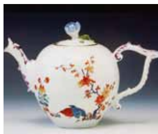
同マイセン倣製品