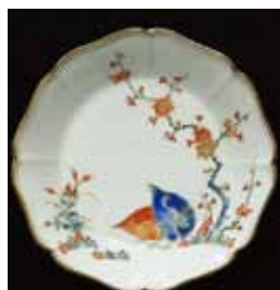
柿右衛門色絵梅鶯文輪花皿

伊万里の名品が、ヨーロッパで一種の日本ブーム(ジャポニスム)を引き起こし、いかに海外に熱狂的に迎えられたかの栄光を物語るものとして、ここに改めて胸を張って誇り得るものなのです。