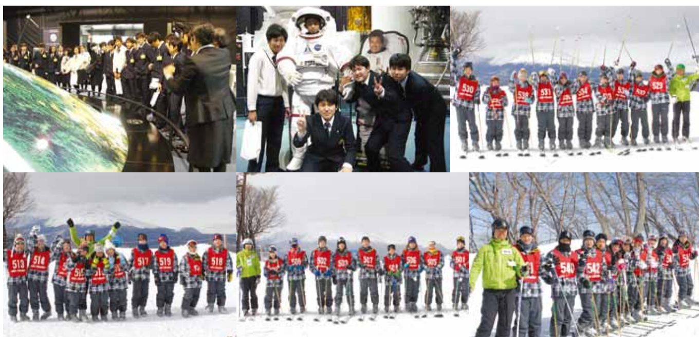
社会体験・スキー教室／中学校