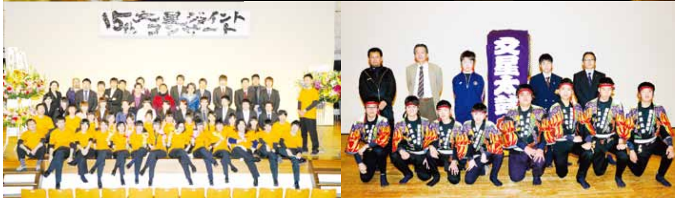
ジョイントコンサート／音楽部・和太鼓部