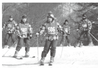
レッスン中の様子